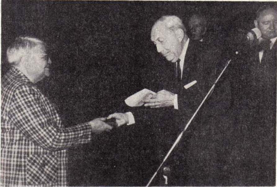
Prof. Çambel Ödülünü Alırken.

Halen aynı hastahanedeki Onursal Danışman olarak çalışmaktadır. Bu törene ait bir resim ile aldığı belgelerin örneklerini sunuyoruz.