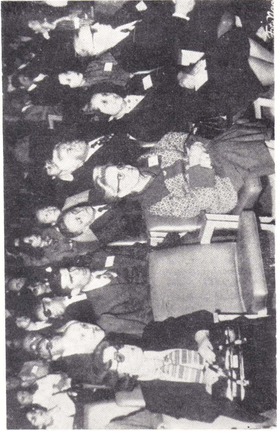
IV. Ulusal Patoloji Kongresinden Bir Görünüm